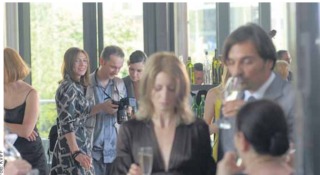
Za sklem se sklenicemi a se skelným pohledem.

Válka, kterou jsme si všichni prošli, v nás zanechala nesmazatelné jizvy – není divu, že