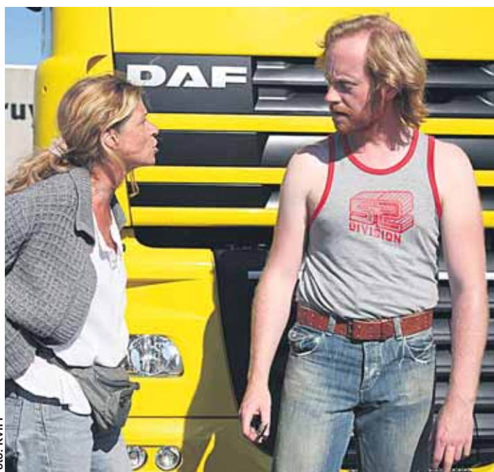
Přeparkuj ten kamion, nebo po tobě hodím hořčici.

Moskva, Belgie dokazuje, jak velkou moc má setkání s jiným člověkem, když se nemůžete pohout z místa. Jen letmé zkřížení osudů vám může dát sílu vykročit vpřed. Mému filmu taky nikdo nevěřil a je natočen. Nakonec se stal trhákem v belgických žebříčcích, uspěl v Cannes a dostal se až sem do Varů. Páni!