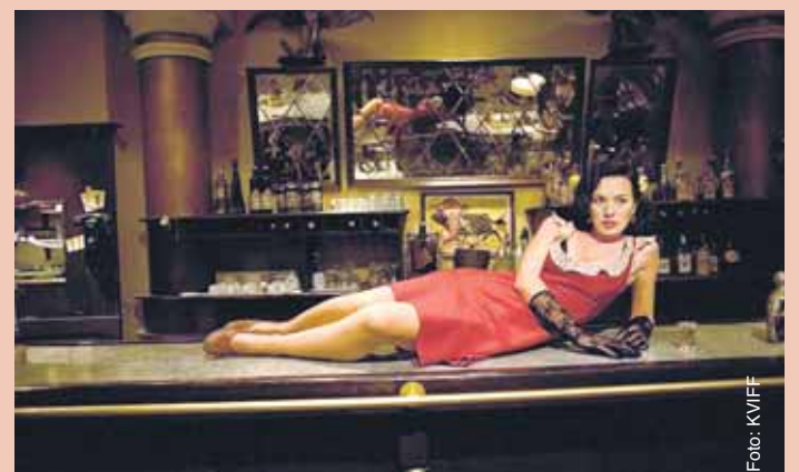
Panna chlípnoti, typicky ripsteinovská.

Ripstein má ve Varech vlastní sedmifilmovou sekci, která nese jeho jméno. Právě v ní můžete zhlédnout scénaristický debut Garcíadiegové: magickorealitický příběh Dionisia, kohouta a krásné La Caponery Říše bohatství . Spolu s Ripsteinem odstartovali novou vlnu mexického filmu, aby se na ní svezli anti-melodramatem Královna noci . Ripsteinovi je v Mexiku často