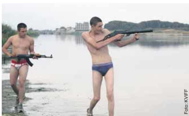
Gomorra: Stůj, nebo se netrefím!