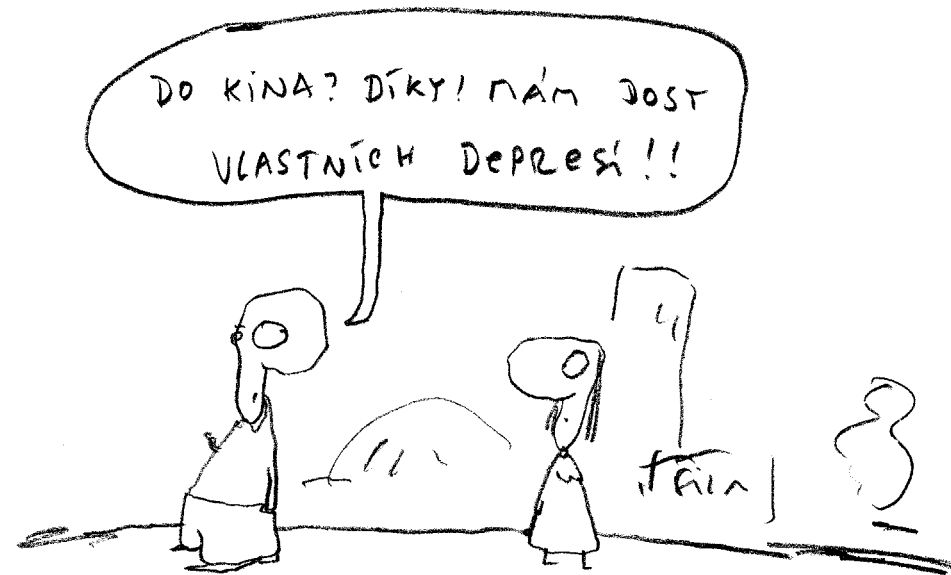
Kresba: Marek Douša

To španělským tvůrcům Xavi-eru Baigovi a Óscaru Morenovi trvalo natáčení filmu Dnešní den vypadá jinak pouhých šest měsíců. Bohužel. Více nestihli,