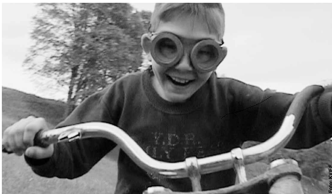
Jedno z devíti dětí Ljuby, hlavní postavy ruského snímku Matka .

V soutěži celovečerních dokumentů najdeme také výborně natočené snímky o pozoruhodných