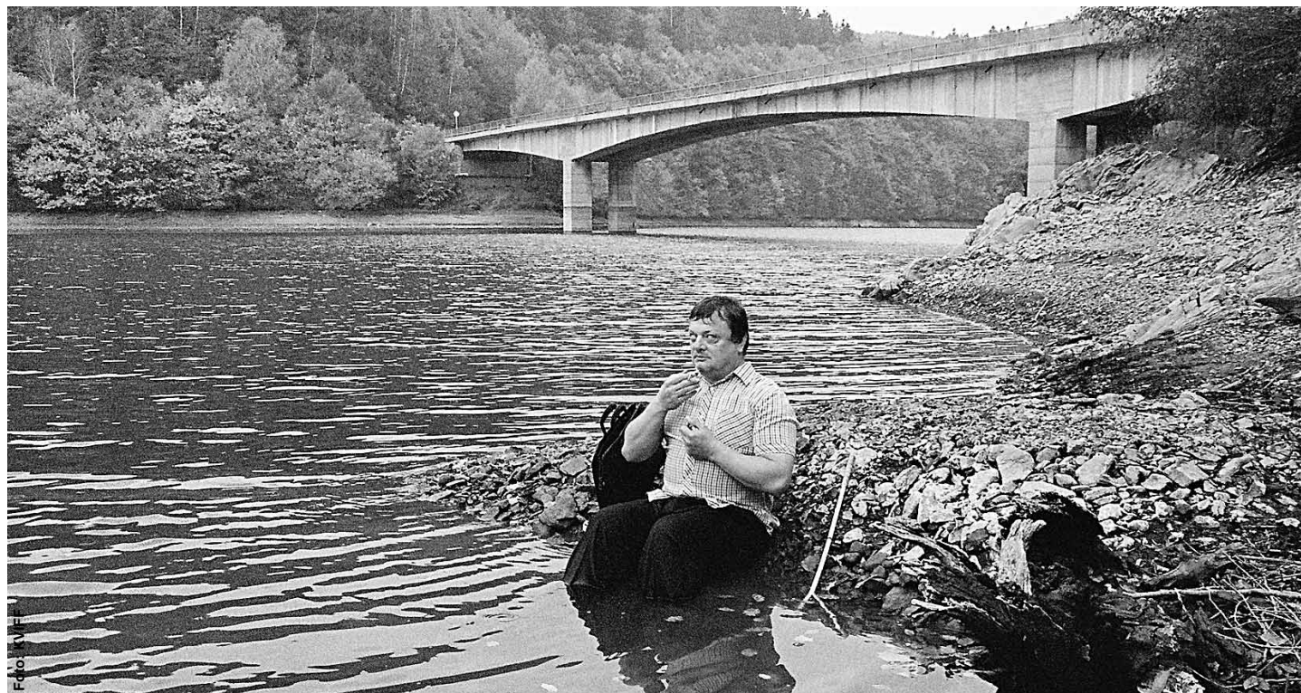
Verneovsko-zemanovské fantazie slepého učitele hudby Petera z filmu Slepé lásky se naplno rozjíždějí pod vodou.

A ve velmi zábavném snímku od producentů Bowling for Columbine a Fahrenheit 9/11 se můžete přesvědčit, do jaké míry se prostředí americké popkultury podepisuje na naší touze být za každou cenu Větší, silnější, rychlejší . ■