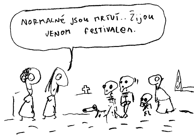
Kresba: Marek Douša