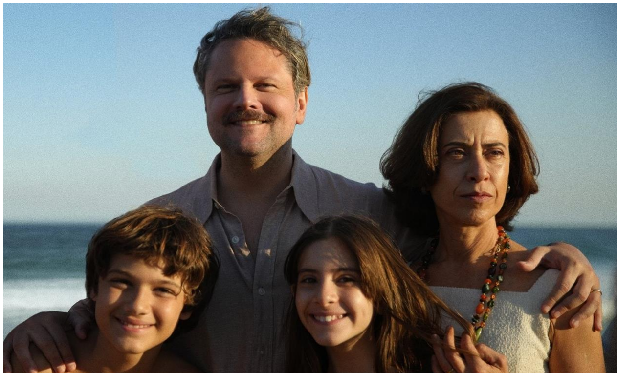
I'm still here