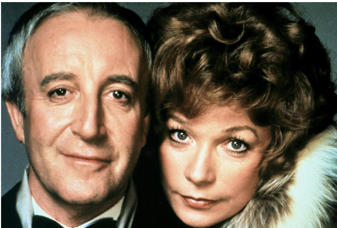
Film Byl jsem při tom

V pátek 17. ledna budou diváci moci od 15 hodin zhlédnout proslulý snímek japonského režiséra Akiry Kurosawy Nebe a peklo (1963, Japonsko), který New York Times označily za jeden z nejlepších detektivních thrillerů všech dob. V 18 hodin bude ke zhlédnutí snímek McCabe a paní Millerová (1971, USA) režiséra Roberta Altmana, od jehož narození letos uplyne sto let. Film je zasazený do roku 1901 a bývalého hazardního hráče Johna Q. McCaba, který si v nehostinné osadě otevře nevěstinec, hraje proslulý herec Warren Beatty. Páteční program uzavře ve 20:30 legendární (a pokud by se dožil, letos taktéž stoletý) Peter Sellers v jednom z nejprovokativnějších filmů své doby o amerických prezidentských volbách Byl jsem při tom (1979, USA).