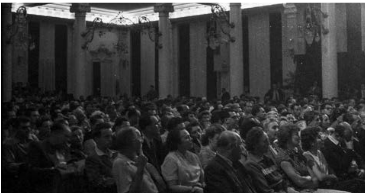
Diváci festivalu v Grandhotelu Pupp, 1948, kredit: Václav Chochola / © Archiv B&M Chochola

Na programu prvního festivalu bylo třináct snímků, které byly v premiéře uvedeny v Mariánských Lázních a následující den v repríze v Karlových Varech. Ceny se poprvé na festivalu udělovaly v roce 1948, od roku 1950 se hostitelským městem staly trvale Karlovy Vary. Do průběhu prvních ročníků, stejně jako do programového výběru již od počátku významně zasahovala politická realita, jíž byl festival nucen čelit. Klíčovou osobností, která po desítky let určovala podobu festivalu, se stal novinář, pedagog a mezinárodně respektovaný odborník Antonín Martin Brousil (1907-1986). Fakticky se podílel na založení festivalu, roky předsedal jeho hlavním porotám a plnil v jistém smyslu neoficiální funkci programového ředitele.