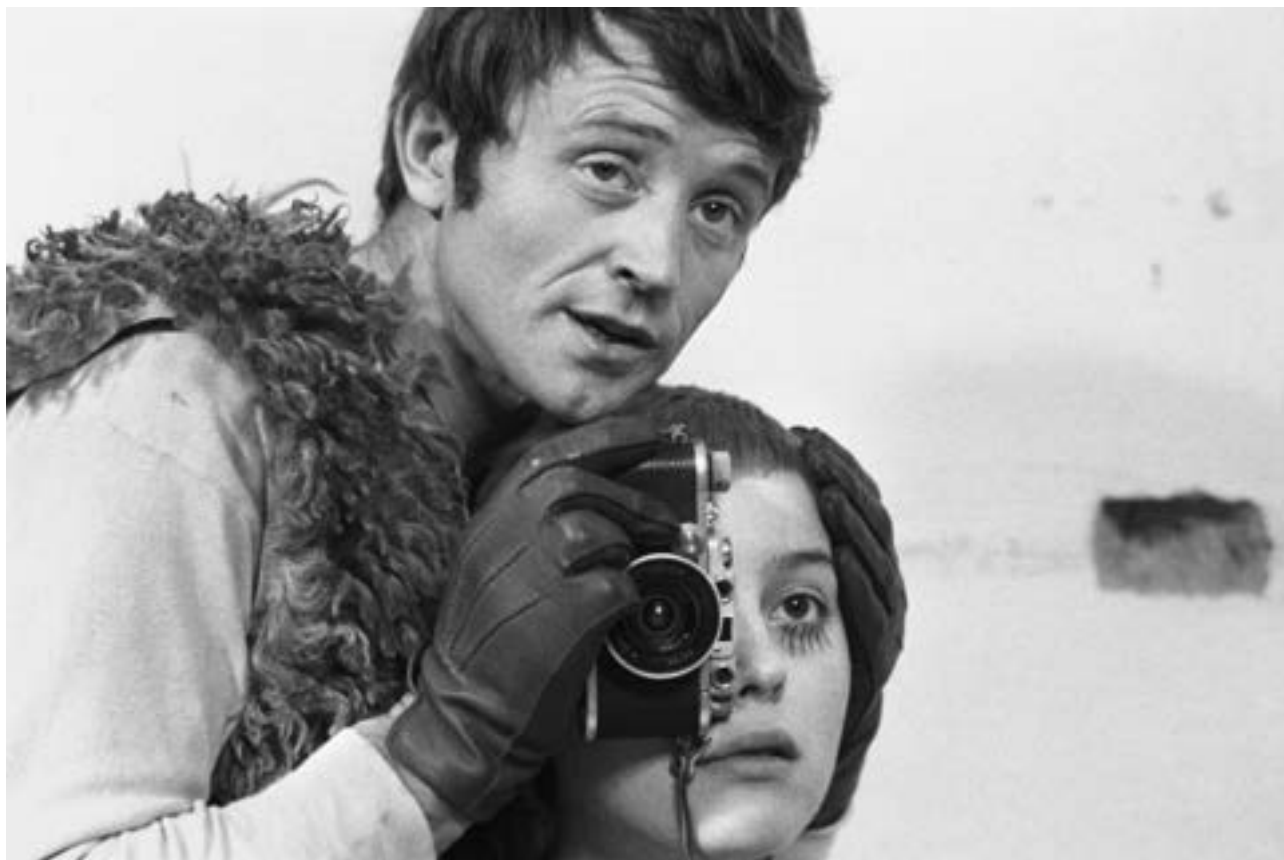
Film Vtáčkovia, siroty a blázni

Karlovy Vary International Film Festival