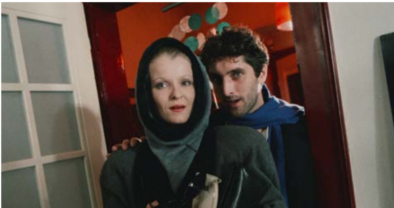
Film Kopytem sem, kopytem tam

Digitálně restaurované snímky jsou uváděny nejen v programu MFF Karlovy Vary, ale také v rámci specializované přehlídky KVIFF Classics. V současné době čítá seznam českých a československých celovečerních a krátkých filmů, které se podařilo digitálně restaurovat, více než stovku titulů.