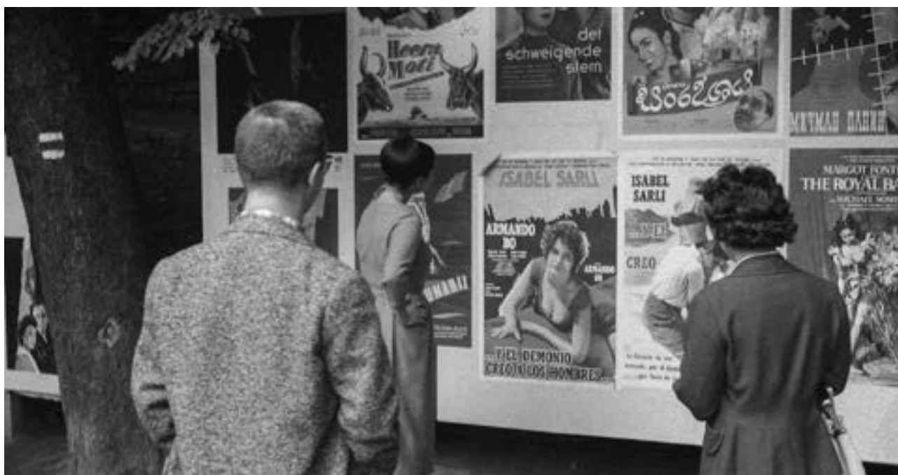
Návštěvníci festivalu, 1948,

Disproporce mezi oběma výročími byla ovlivněna několika skutečnostmi. V letech 1953 a 1955 se festival nekonal, posléze mu byla vnucena politickým rozhodnutím dvouletá periodicita. Festival, který byl mezinárodní organizací FIAPF v roce 1957 uznán jako přehlídka kategorie A (podobně jako např. festivaly v Cannes či Benátkách), se tak musel o prestižní označení podělit od roku 1959 s nově vzniklým filmovým festivalem v Moskvě.