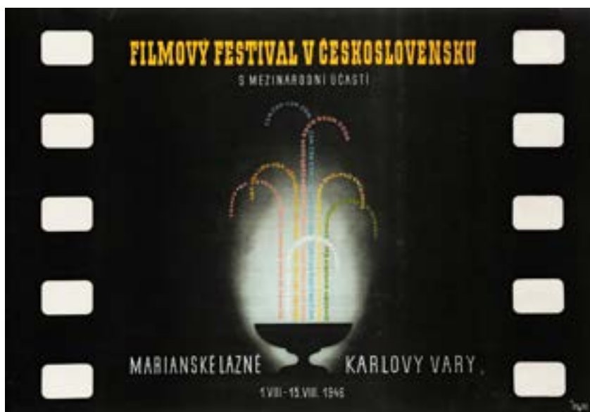
Plakát prvního ročníku festivalu, 1946