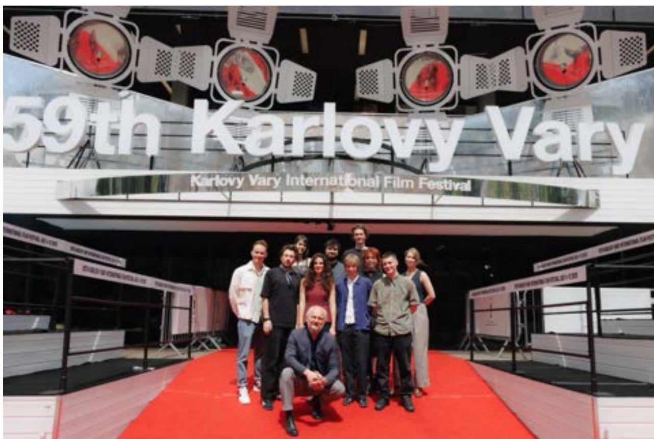
Ložští účastníci Future Frames

Program Future Frames – Generation NEXT of European Cinema, organizovaný MFF Karlovy Vary a European Film Promotion, již od roku 2015 pomáhá talentovaným evropským režisérům nastartovat jejich kariéru ve filmovém průmyslu. Již čtvrtým rokem program rozšiřuje své příležitosti díky partnerství se společností Allwyn, zaměřenou na loterie a zábavu, a díky spolupráci s americkou talentovou agenturou UTA a společností Range Media Partners, které mladým filmařům poskytují cenné odborné vedení a možnost navázat klíčové kontakty.