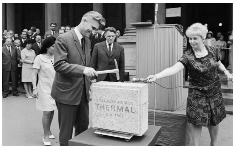
Ministr kultury a informací Miroslav Galuška poklepává na základní kámen budoucího Thermalu (1968).

Festival tehdy získával stále otevřenější atmosféru. Na tzv. Volných tribunách se debatovalo o filmu jako umění, televizní pořad Momenty s Miroslavem Horníčkem přibližoval festival široké veřejnosti a do Varů začínali jezdit významní zahraniční producenti i distributoři. Pak ale přišel srpen 1968.