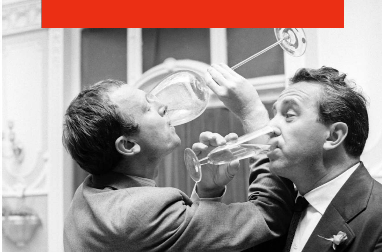
Sovětský herec Innokentij Smoktunovskij s Miroslavem Horníčkem, 1962.