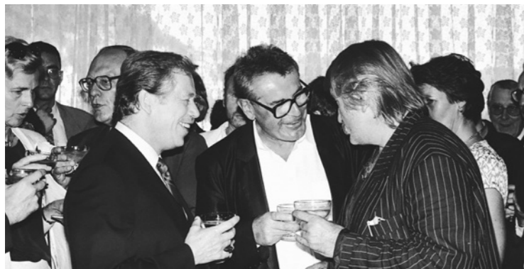
Trojice umělců a dlouholetých přátel společně na svobodném festivalu v roce 1990: dramatik a politik Václav Havel, režisér Miloš Forman a herec Pavel Landovský.