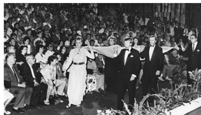
Zahajovací ceremoniál MFF v roce 1984.

Přesto i v těchto letech vznikaly silné momenty. V roce 1970 vyhrál Ken Loach s filmem Kes, v roce 1978 získaly hlavní cenu Vláčilovy Stíny horkého léta a právě tehdy se festival konečně přestěhoval do hotelu Thermal — budovy, která se měla stát jeho symbolem na další desetiletí. Monumentální brutalistní stavba vyvolávala při výstavbě odpor části místních obyvatel, dnes si bez ní ale KVIFF už nelze představit.