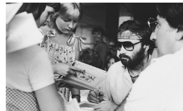
Italský herec Franco Nero (1982).

Normalizace změnila i Karlovy Vary. Z vedení zmizely nepohodlné osobnosti, přibylo funkcionářů z východního bloku a kontakty se zahraničím se znovu komplikovaly. Festival přerušil spolupráci s Mezinárodní federací filmových kritiků FIPRESCI kvůli jejímu protestu proti okupaci Československa vojsky Varšavské smlouvy. Atmosféra se uzavřela, diskuse dostaly pevné mantinely a festival se znovu stal více reprezentativní než živou kulturní událostí.