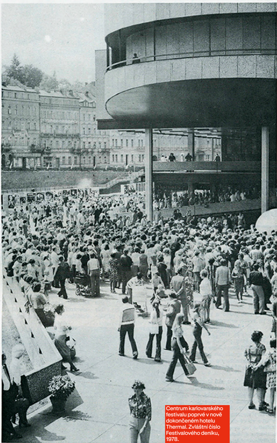
Centrum karlovarského festivalu poprvé v nově dokončeném hotelu Thermal. Zvláštní číslo Festivalového deníku, 1978.

Komunistické straně Československa dosahuje filmová tvorba i teorie úspěchů a náš film získává stále větší počet diváků u nás i ve světě. Úspěšně se rozvíjí mezinárodní styky, které jsou důkazem naší principiální kulturní politiky odpovídající karlovarskému festivalovému heslu „ZA UŠLECHTILÉ VZTAHY MEZI LIDMI, ZA TRVALÉ PŘÁTELSTVÍ MEZI NÁRODY“