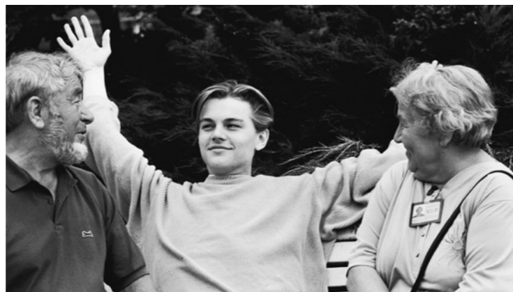
Vycházející hvězdu Leonarda DiCaprio zachytil fotograf Miloš Fikejz s prarodiči na lavičce před Thermalem (1994).

Velkou proměnou prošlo i publikum. Do Karlových Varů začali jezdit mladí lidé s batohy, kteří sem nepřijížděli za společenskou reprezentací, ale hlavně za filmy. Právě tehdy vznikala specifická festivalová atmosféra, která je pro KVIFF typická dodnes.