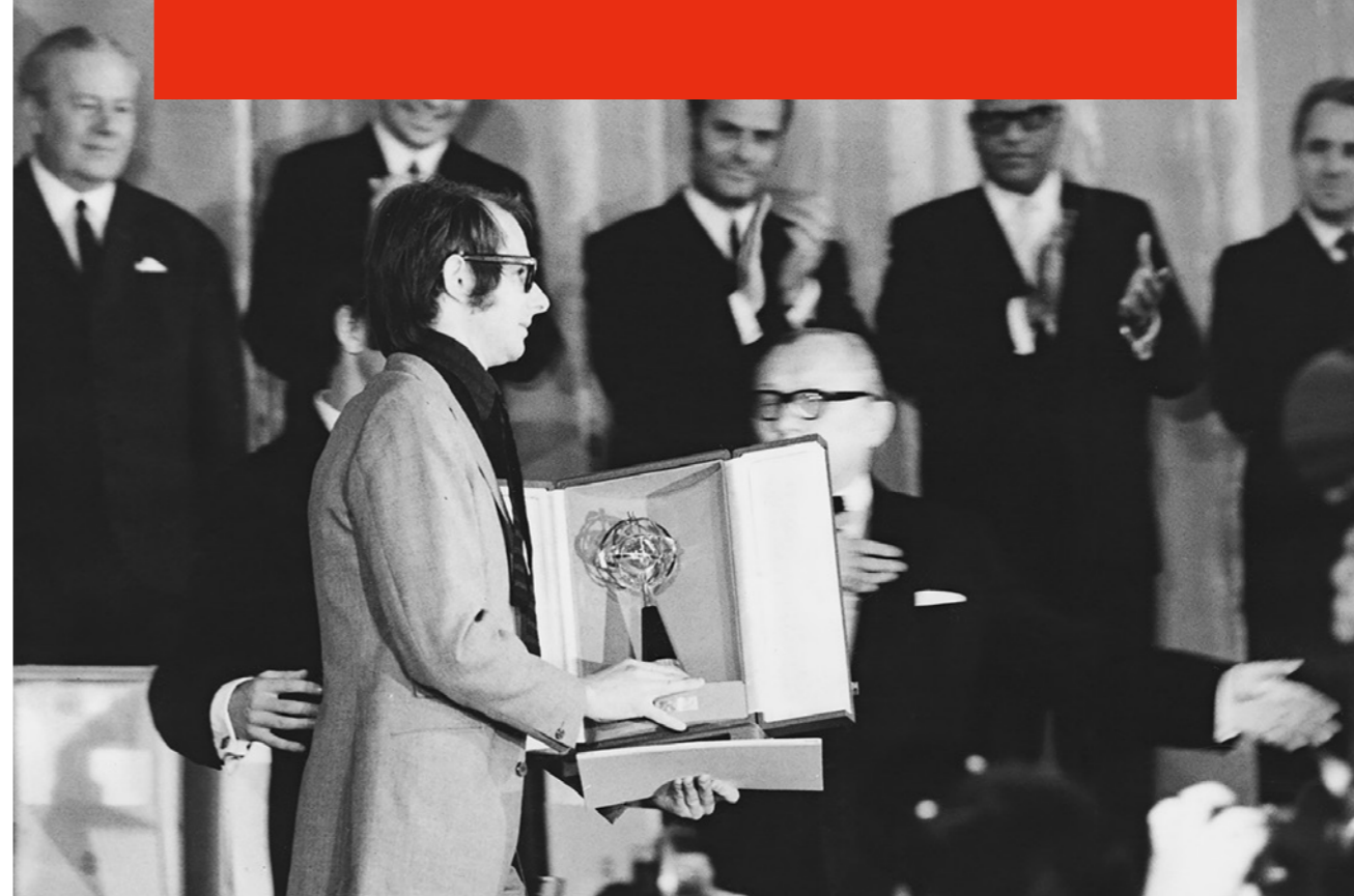
Britský režisér Ken Loach přebírá Křišťálový glóbus za film Kes.

„ZA UŠLECHTILÉ VZTAHY MEZI LIDMI, ZA TRVALÉ PŘÁTELSTVÍ MEZI NÁRODY“